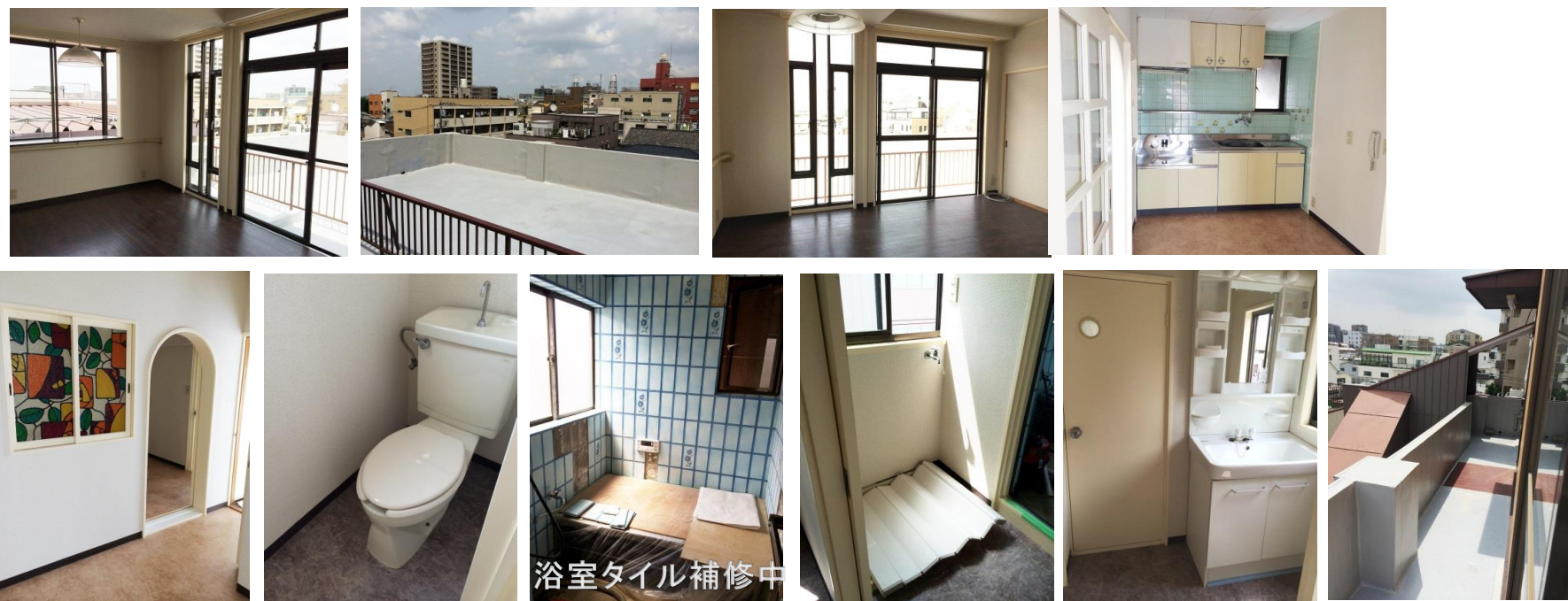
浴室タイル補修中

東京都知事(3)第77522号 株式会社 タープ不動産情報 URL >>> http://www.tarp.co.jp